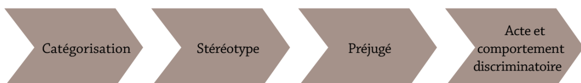
Schéma des processus discriminatoires

Quant aux stéréotypes sexistes , ils sont acquis encore plus tôt dans l'enfance. Non seulement les parents se comportent très différemment avec un enfant selon que c'est un garçon ou une fille, mais les livres, émissions de télévisions, etc. véhiculent les stéréotypes traditionnels.